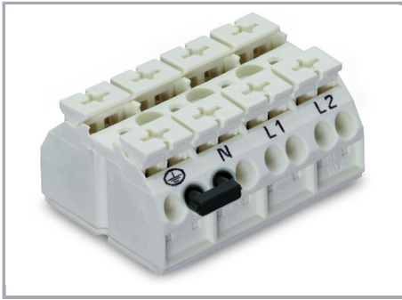
Pontage avec un peigne de pontage (862-482)

Sous réserve de modifications. Veuillez tenir compte de la documentation du produit !